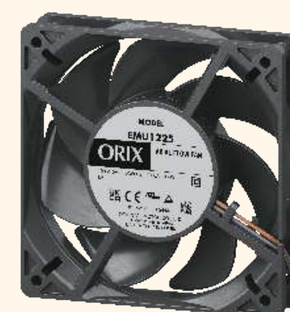
EMUシリーズ 取付角寸法 92mm~120mm

EMR20 : 306kWh/年 従来製品に対して 30 % 削減 ※24時間365日稼働