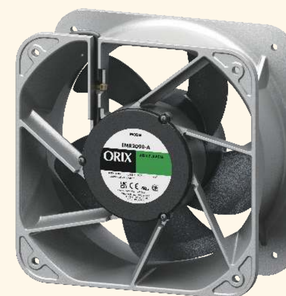
EMRシリーズ 取付角寸法 180mm~200mm